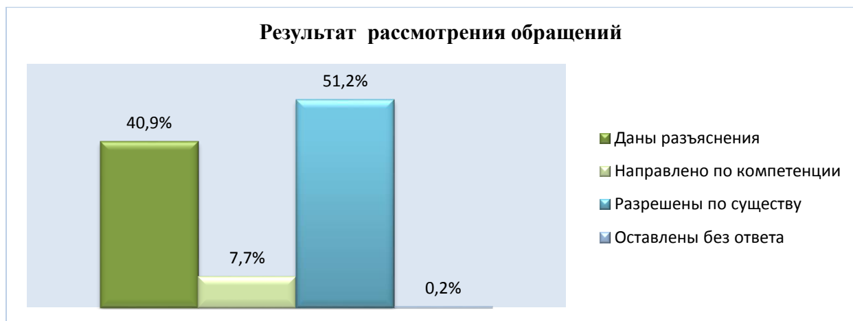
Диаграмма классификации обращений по результату рассмотрения.

98,9% обращений рассмотрены депутатами в течение 30 дней – основной срок, предусмотренный законом от 2 мая 2006 года № 59 ФЗ для рассмотрения обращений, 1,1% обращений рассмотрены с продлением срока.