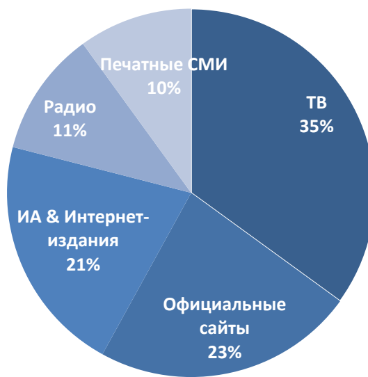
Диаграмма 2. Распределение материалов о деятельности депутата в 2016 году (октябрь-декабрь 2016 г.) по видам СМИ (в % от общего числа сообщений)

На региональном уровне о парламентарии чаще всего писали на официальном сайте Думы автономного округа dumahmeo.ru , на страницах ведущего новостного портала Югры ugra-news.ru , а также на сайте регионального отделения партии «Единая Россия».